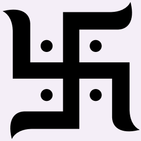
Figure 1: Swastika hindou

Le swastika . De nombreuses personnes sont mal à l'aise par rapport au swastika (ou croix gammée) en raison de sa mauvaise utilisation et de son appropriation comme le symbole de l'idéologie nazie. Le swastika nazi est positionné en diagonale, tandis que pour l'hindouisme, il est parallèle à l'horizon. Contrairement à sa connotation négative causée par l'appropriation nazie, en sanskrit, swastika signifie « la chance » ou « être heureux·euse ». Le symbole du swastika est souvent présent aux entrées des temples et des maisons, ainsi que sur les autels et sanctuaires du domicile. Lors des pujas (cérémonies, rituels), un swastika est également dessiné à l'aide de curcuma ou de cendres sacrées.