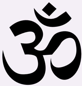
Figure 2: Symbole Aum

Le swastika . De nombreuses personnes sont mal à l'aise par rapport au swastika (ou croix gammée) en raison de sa mauvaise utilisation et de son appropriation comme le symbole de l'idéologie nazie. Le swastika nazi est positionné en diagonale, tandis que pour l'hindouisme, il est parallèle à l'horizon. Contrairement à sa connotation négative causée par l'appropriation nazie, en sanskrit, swastika signifie « la chance » ou « être heureux·euse ». Le symbole du swastika est souvent présent aux entrées des temples et des maisons, ainsi que sur les autels et sanctuaires du domicile. Lors des pujas (cérémonies, rituels), un swastika est également dessiné à l'aide de curcuma ou de cendres sacrées.